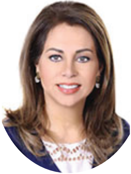
سهير العلي رئيس الصندوق

” إنه لمن دواعي سرورنا تقديم تقرير الاستدامة الأول لصندوق استثمار أموال الضمان الاجتماعي والذي يعرض التقدم الذي أحرزته صندوق الاستثمار للمساهمة في دفع عجلة النمو الاقتصادي والمشاركة في تحقيق الاستدامة البيئية والاجتماعية في المملكة الأردنية الهاشمية. ويسلط هذا التقرير الضوء على مبادرات الصندوق الرامية لتطبيق أفضل الممارسات في التعامل مع القضايا الاقتصادية والاجتماعية في صناعة القرار بطريقة تتسم بالشفافية والتنظيم وبما يتماشى مع الرؤية المستقبلية