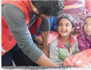
العودة إلى المدارس - مبادرة الحقائب المدرسية

تركز مهمة ورسالة صندوق الاستثمار على تحقيق التنمية الاجتماعية المنشودة من خلال مجموعة من المبادرات المدروسة لعلاج القضايا الاجتماعية التي لها تأثير على المدى الطويل والإنجازات النوعية خدمة لمصالح المجتمع الأردني، بتعزيز العلاقة مع المجتمع والمواطن ودعم المؤسسات الاجتماعية والجمعيات الخيرية والأفراد