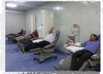
حملات التبرع بالدم