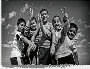
بنك الملابس الخيري